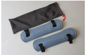
サーフボードパッド