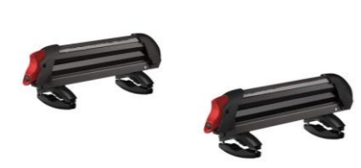
スキー&スノーボード ラック